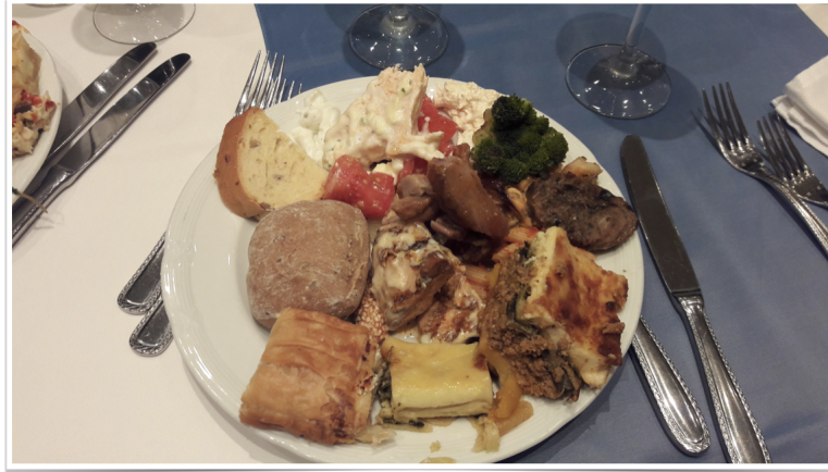
Figure 2: Reception 음식

여태껏 참석했던 학회들에서 제공되었던 식사들과 달리, 이번 학회에서 제공되는 음식들은 내 입맛에 정말 딱 맞았다. 뷔페식으로 제공되었는데, 매 식사마다 한번 먹고 또 먹고 싶을 정도였다. Reception에서 나온 음식들도 정말 맛있었다.