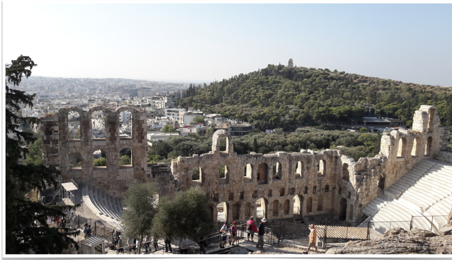
Figure 1: 아크로폴리스에서 바라본 풍경