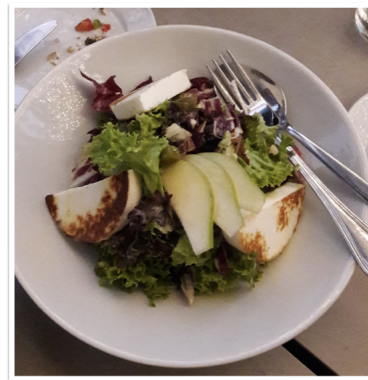
Figure 5: 먹었던 음식들