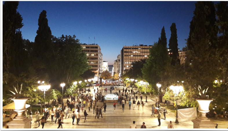
Figure 4: 아테네 밤 풍경

OOPSLA 개최 일정 전후의 시간 여유를 활용하여 아크로폴리스, 아크로폴리스 박물관 등 아테네의 관광지들을 둘러볼 수 있었다. 특히 아크로폴리스 언덕에서는 아테네 시내 전역의 멋진 풍경을 바라볼 수 있었다. 10월의 아테네는 반바지를 입어도 될 정도로 약간 덥고 건조하였다. 로컬 음식들은 너무 짜거나/달거나 양 극단 중 하나에 속하는 경우가 대부분이었는데, 내 입맛에 맞는 음식들도 꽤나 있었다. 아테네에 관광객들이 많아서인지는 모르겠으나, 대부분의 그리스 사람들은 영어를 잘해서 여행하는데 큰 어려움은 없었다.