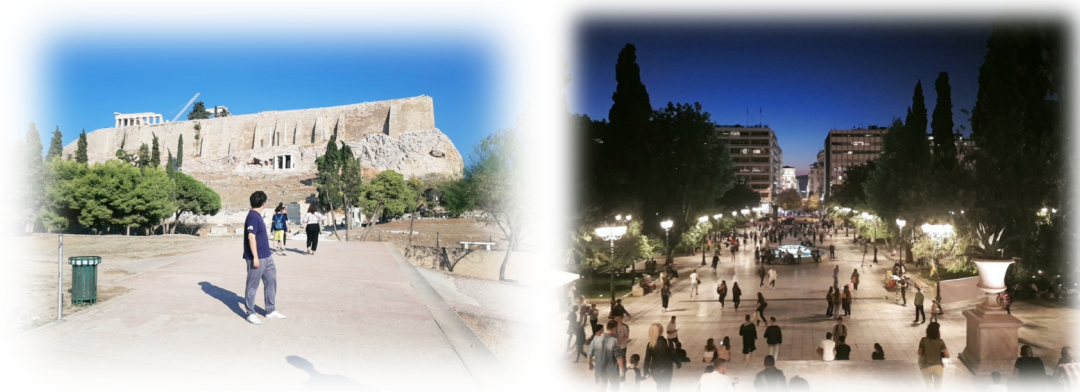
Figure 1: 아테네의 낮과 밤

아테네는 관광지였기에 많은 볼거리, 먹거리 등이 있었다. 작년 OOPSLA 에서 Yannis Smaragdakis 교수님(올해 general chair)이 너무 좋은 곳이니 꼭 와야 한다고 홍보를 했었는데, 홍보하신 것 이상으로 멋진 곳이었다. 학회 기간은 10 월 말이었는데, 구름 한 점 없는 맑은 날씨와 적당한 온도에서 다양한 신전들과 박물관들을 구경 할 수 있었다. 작년 OOPSLA 가 열린 보스턴에선 매일 비가 왔었고, 볼 것 이라고는 MIT 와 Havard 밖에 없었기에 열리는 곳이 참 중요하다는 것을 느꼈다. OOPSLA 가 북미가 아닌 곳에서 열린 것이 이번이 2 번째라고 한다. 북미에서 열리는 것 2 번(2017, 2018)을 가봤었는데, 개인적으로는 북미보다 유럽이 훨씬 좋았다.