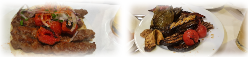
Figure 1: best and worst food

아테네 음식은 굉장히 짜다. 매일 저녁 아테네의 로컬 음식점에 가서 다양한 음식들을 시켜 먹었는데, 대부분의 음식이 짜더라. 맛있는 것들도 있었지만, 어떤 음식은 아예 못 먹을 정도였다. 학회에서 제공되는 음식은 다행히 입맛에 맞게 나와 먹는 것 때문에 고생을 하진 않았다.