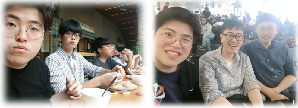
Figure 3: 같이 참석한 동료들