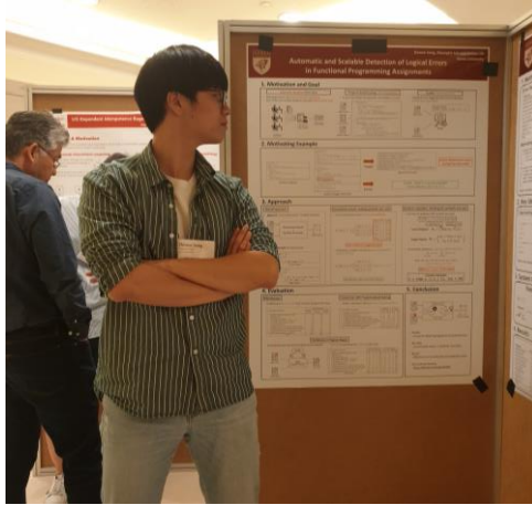
<포스터 세션 - 바로 옆에 SAVER 포스터가 있다>

들었다. 내가 좋다고 느낀 발표들은 모두 항상 풀고자 하는 문제를 정확히 전달한 발표들이었다. 따라서 디테일 보다는 그런 쪽에 좀 더 포커스를 맞췄다. 문제를 잘 설득시키는 것은 역시 연구에서 가장 중요한 작업인 것 같다.