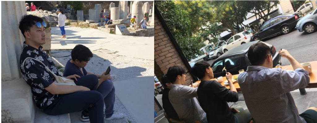
<함께 학회 참석을 한 연구실 동료들>

같다. 아마 혼자 학회장에 왔으면 이렇게 좋은 시간을 못 보냈을 것이다. 이 자리를 빌려 다시 학회에 같이 참석한 동료들에게 감사인사를 전하고 싶다.